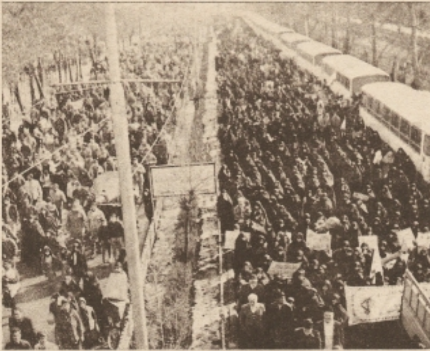
'Meydan-ı Azâdî'ye doğru akan insanî sellerinden bir görüntü!..