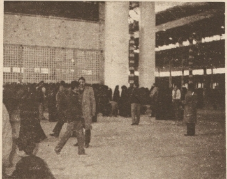
Yapımı devam eden İmam Humeynî'nin türbesinin içinden görünüşü!..

İstikbale ümit dolu bir gözle bak- mamıza sebep olan, 'Azadî mey- danı'deki 11- Şubat (22 Behmen) merasimi, unutulmaz anılarını biz- lerde bırakarak sona ererken, biz de yavaş yavaş kaldığımız otele dönüyor, böyle bir İnkılabı bizlere lütfettiğinden dolayı yüce Rabbimize sonsuz hamd-ü senalar ve şükürler ediyoruz!.. Birkaç gün daha bir kısım kardeşleri ve yerleri ziyaret ettikten, sizler için gerekli bazı mülakatlar yaptıktan sonra, huzur ve sükun dolu bir kalble ayrılıp Türkiye'ye giriş yapı- yorum. Böylece mutlu bir gezinin hatıralar ve anılar kapısını şimdilik kapatıyorum... Allah'ın selamı Hiz- bullah ümmetinin üzerine olsun. Amin.