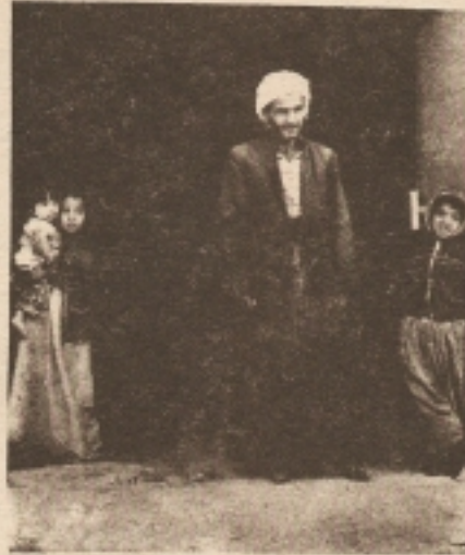
Bu mazlum insanlar biraz sonra katledeceklerini nereden bileceklerdi?

Katledilen mazlum Halepçe ve çevresindeki müslüman Kürd halkı, Irak rejimi ile savaşmayan ve savaşmasını da bilmeyen çocuk-çocuk ve kadın-ihiyar sivillerden oluşan mustaz'aflardır... O halde, bütün vicdan sahibi insanlar mezkûr ayet-i kerime'nin ışığı altında sormalı: "Mazlum ve mustaz'af Halepçe Müslüman Kürd halkı, neden ve hangi